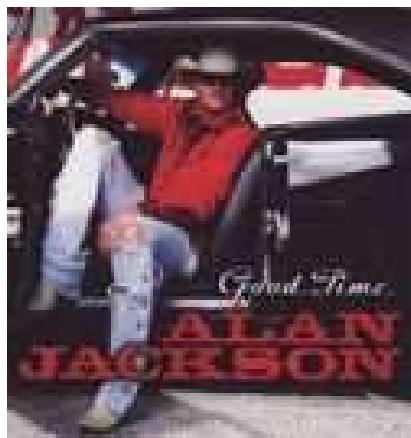
Parmi les artistes country, Alan Jackson est un authentique honky tonk héros. Son cœur bat au rythme de la country traditionnelle pur et dur sans fioritures.